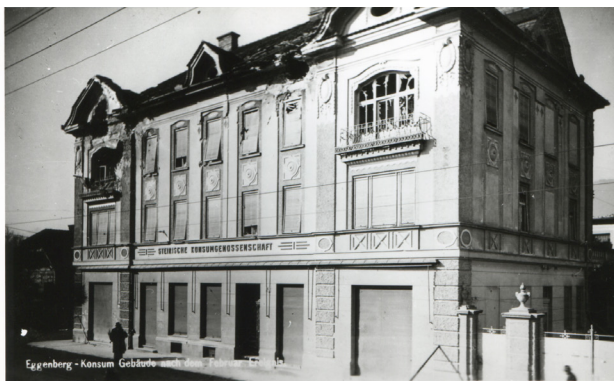
Februar 1934, Konsum in Graz- Eggenberg